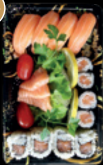
Box 3 / Salmone small