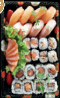
Box 4 / Salmone plus