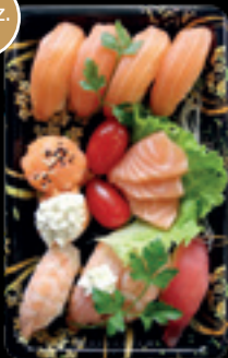
Box 1 / Sushi Sashimi small