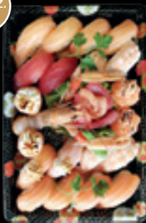
Box 2 / Sushi Sashimi misto